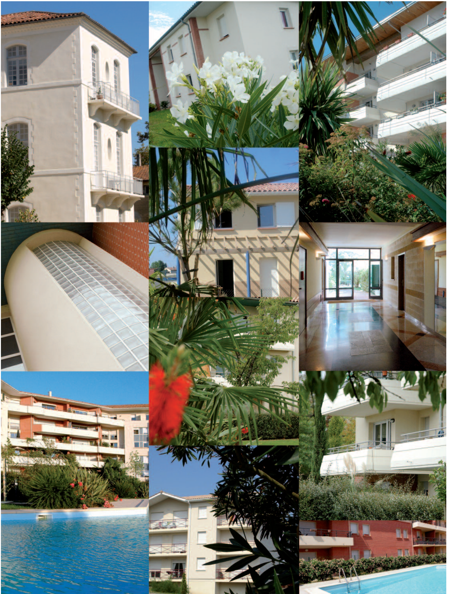
L'ensemble des illustrations de ce document sont des exemples des résidences gérées par le Groupe Patrimoines de France - Eliece. Photos non contractuelles.